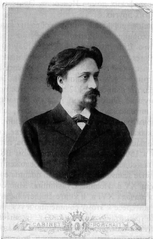
М. П. Азанчевский (1839–1881). Фото, XIX в. (из фонда Отдела рукописей НМБ СПбГК)

ний, как: философия и теология, филология и литература, точные науки. В книжном собрании также имеются учебные пособия по изучению древних языков, грамматике, риторике, медицине, математические трактаты и поэтические сборники, что значительно расширяет круг ее читателей.